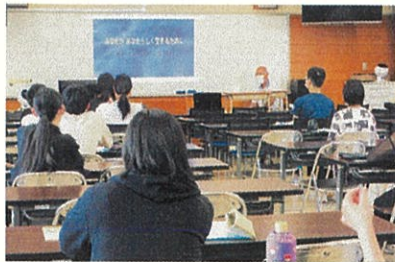
松山東高校通信制 (R5.7.23)