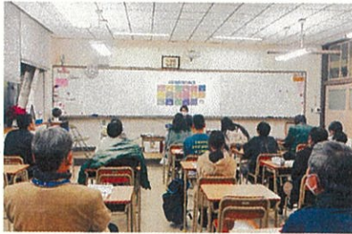
宇和島東高校定時制(R6.1.12)