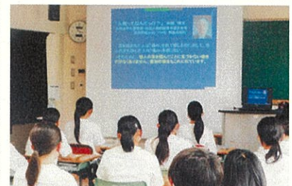
愛媛大学附属高校 (R5.6.22)