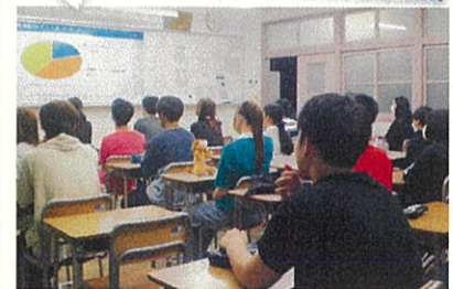
松山南高校定時制 (R5.6.15)