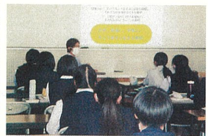
松山南高校 砲部分校 (R5.11.8)