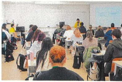
今治看護専門学校(R6.2.15)